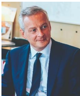
Bruno Le Maire, Ministre de l'Économie, des Finances et de la Relance