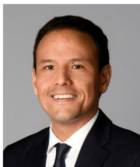
Cédric O, Secrétaire d'Etat chargé de la Transition numérique et des Communications électroniques

Le 29 mars 2018 au Collège de France, le Président de la République présentait sa vision et sa stratégie pour faire de la France un pays leader de l'intelligence artificielle. Nous arrivons aujourd'hui au terme de la première phase de cette stratégie nationale pour l'IA.