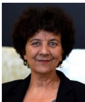
Frédérique Vidal, Ministre de l'Enseignement supérieur, de la Recherche et de l'Innovation